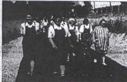
Otvoritev ceste v Bišečkem Vrhu 14. avgusta letos

Dopolodne od devete ure naprej bodo potekale športne prireditve, in sicer turnir v malem nogometu med vami, turnir žolskih ekip malega nogometa iz osnovnih šol Destrnik, Vitomarci in Trnovska vas, košarkarska tekma in na koncu tekma med slovensko reprezentanco v malem nogometu in eki-